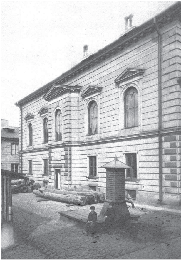
5. Biblioteka Ordynacji Zamojskich przy pałacu Błękitnym w Warszawie, stan sprzed 1939 r.

5. Zamojski Family Library by the Blue Palace in Warsaw, state as of before 1939.