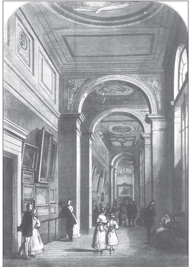
6. Wnętrze sali wystawowej Towarzystwa Zachęty Sztuk Pięknych w Odwachu Bernardyńskim przy kościele św. Anny w Warszawie, „Tygodnik Ilustrowany”, 1870, nr 147, s. 200

Architekt był także autorem projektu budynku szpitala dziecięcego (il. 8). Korzystając ze swych