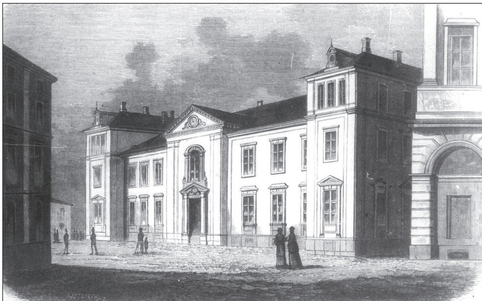
8. Szpital dziecięcy przy ul. Aleksandria (obecnie Kopernika) w Warszawie, „Tygodnik Ilustrowany”, 1875, nr 327, s.104 8. Children Hospital at Aleksandria Street (currently Kopernika) in Warsaw, „Tygodnik Ilustrowany”, 1875, no. 327, p.104