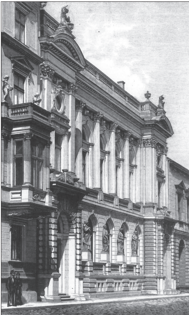
9. Siedziba Towarzystwa Kredytowego Miejskiego przy ul. Włodzimierskiej (obecnie Czackiego) w Warszawie, „Kłosy”, 1881, nr 1, s. 4