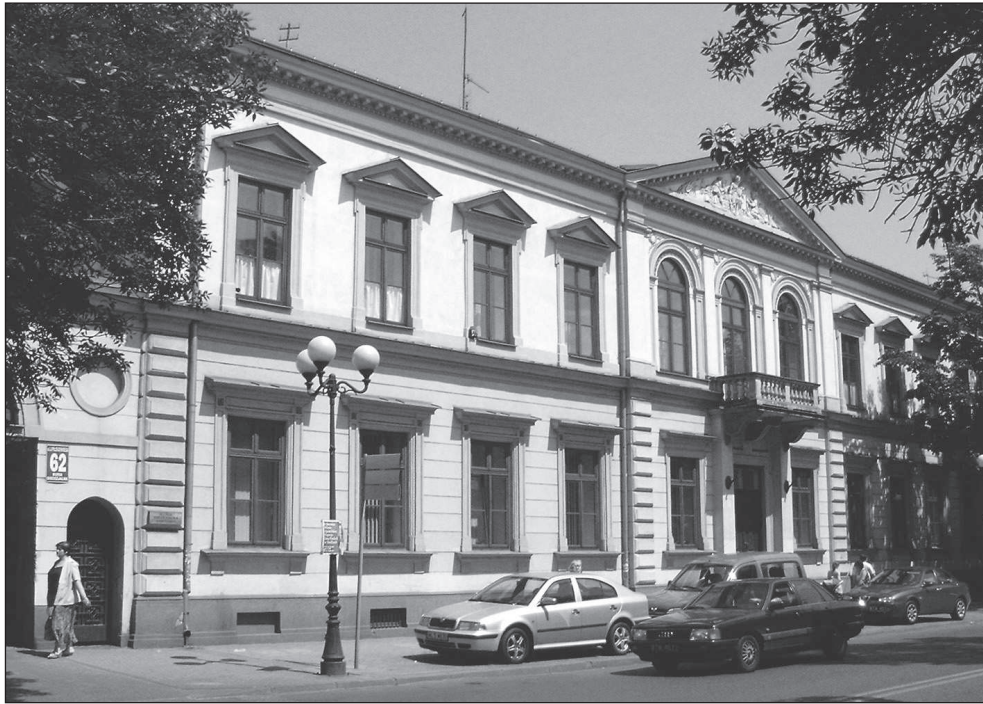
7. Budynek Towarzystwa Kredytowego Ziemskiego w Siedlcach, 2007, fot. Autorka 7. Building of the Land Credit Society in Siedlce, 2007, photo Author