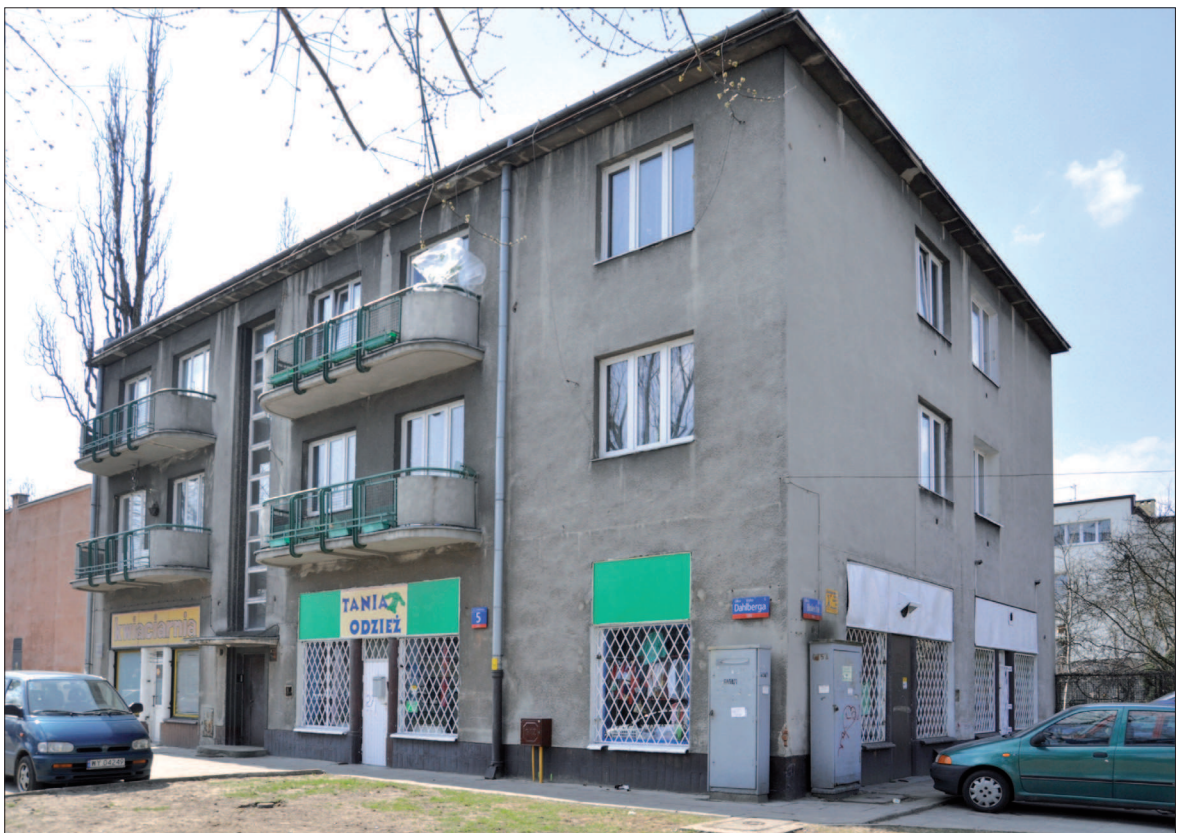
32. Warszawa, kamienica wielorodzinna, ok. 1937-39. Proj. Konstanty Rozwadowski. Zachodnia strona ul. Dahlberga. 2011 r. 32. Warsaw, multifamily tenement house, ca. 1937 – 39, designer Konstanty Rozwadowski. Western side of Dahlberga Street, 2011