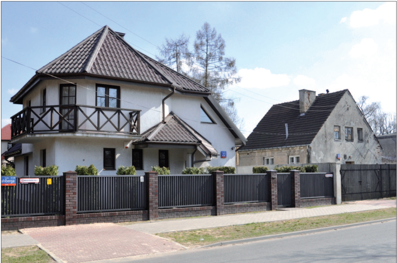
34. Warszawa, dwa domy wolnostojące „typ 13”, 1935 r. Proj. Tadeusz Ćwierdziński, Roman Gürtler. Dom po lewej znacznie przebudowany, dom po prawej bardzo dobrze zachowany. Wschodnia strona ul. Dahlberga. Fot. Autorka, 2011 r. 34. Warsaw, two detached houses „type 13”, year 1935, designer Tadeusz Ćwierdziński, Roman Gürtler. House on the left extensively modernized, house on the right well preserved. Eastern frontage of Dahlberga Street. Photo by the Author, 2011.