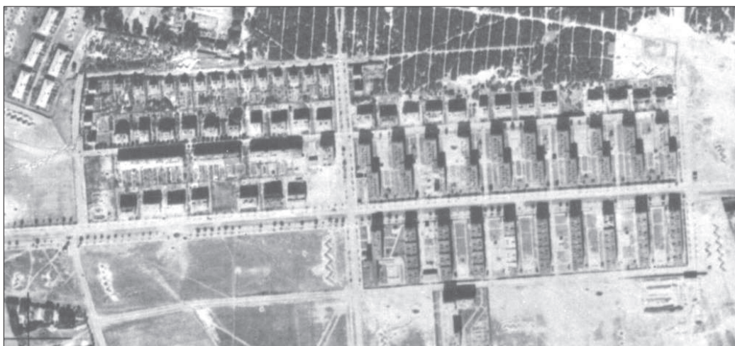
30. Warszawa, osiedle wystawowe BGK, 1939 r. Źródło: Archiwum Państwowe M. St. Warszawy, Kolekcja materiałów teledetekcyjnych, sygn. F4 30. Warsaw, BGK exhibition estate, 1939. Source: The State Archive of the Capital City of Warsaw, Kolekcja materiałów teledetekcyjnych, catalogue No F 4

Jeszcze przed 1939 r. koncepcja parcelacyjna wg szkicu pomiarowego z 1934 r. uległa niewielkim modyfikacjom. Zmienił się charakter parcelacji przy ul. Dahlberga i Dalibora. Przy ul. Dahlberga, na odcinku między Bolecha a Obozową, pierwotnie wytyczono działki wąskie, co wskazywałoby na planowanie w tym miejscu budowy domu szeregowego, wielosegmentowego. Jednak w 1937 r. pojawił się plan, na którym w tym miejscu zaznaczono trzy szerokie działki budowlane 52 . Na działce u zbiegu ulic Bolecha i Dahlberga (ul. Dahlberga 5) stanęła trzykondygnacyjna kamienica projektu Konstantego Rozwadowskiego 53 (ukończona w 1938 lub w 1939 r. 54 ) (il. 32), na działce na rogu Dahlberga i Obozowej - miał stanąć obiekt podobny w skali 55 . Nigdy go jednak nie zrealizowano, a w tym miejscu po 1945 r. powstał kompleks usługowo-handlowy.