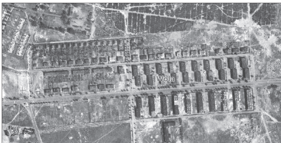
33. Warszawa, osiedle wystawowe BGK, 1945 r. Internet: http://www.mapa.um.warszawa.pl/mapa/Mapa.aspx?service=Historical , 33. Warsaw, BGK exhibition estate, 1945, http://www.mapa.um.warszawa.pl/mapa/Mapa.aspx?service=Historical

także pozostał bez zmian 59 . W latach 70. XX w. w bezpośrednim sąsiedztwie osiedla powstała grupa wieżowców silnie kontrastująca z niską zabudową jednorodziną.