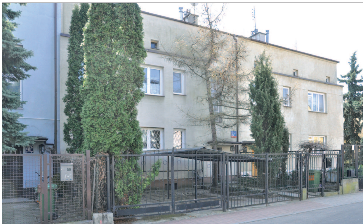
27. Warszawa, dom szeregowy, segment „typ 412”, 1935 r. Proj. Maria Zachwatowicz. Południowa strona ul. Bolecha. Fot. Autorka, 2011 r.

26. Warsaw, terraced house, section „type 404”, 1935, designed by Barbara and Stanisław Brukalscy. Southern side of Bolecha Street. Photo by the Author 2011