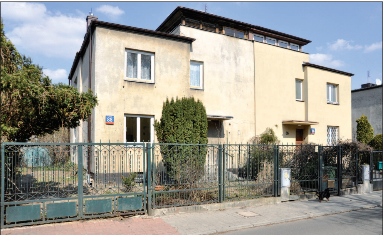
25. Warszawa, dom bliźniaczy „typ 408”, 1935 r. Proj. Barbara i Stanisław Brukalscy. Północna strona ul. Bolecha. Fot. Autorka, 2011 r. 25. Warsaw, semidetached house „type 408”, 1935, designed by Barbara and Stanisław Brukalscy, Northern side of Bolecha Street. Photo by the Author, 2011