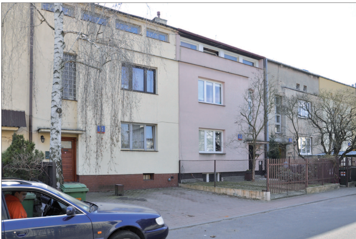
26. Warszawa, dom szeregowy, segment „typ 404”, 1935 r. Proj. Barbara i Stanisław Brukalscy. Południowa strona ul. Bolecha. Fot. Autorka, 2011 r.

26. Warsaw, terraced house, section „type 404”, 1935, designed by Barbara and Stanisław Brukalscy. Southern side of Bolecha Street. Photo by the Author 2011