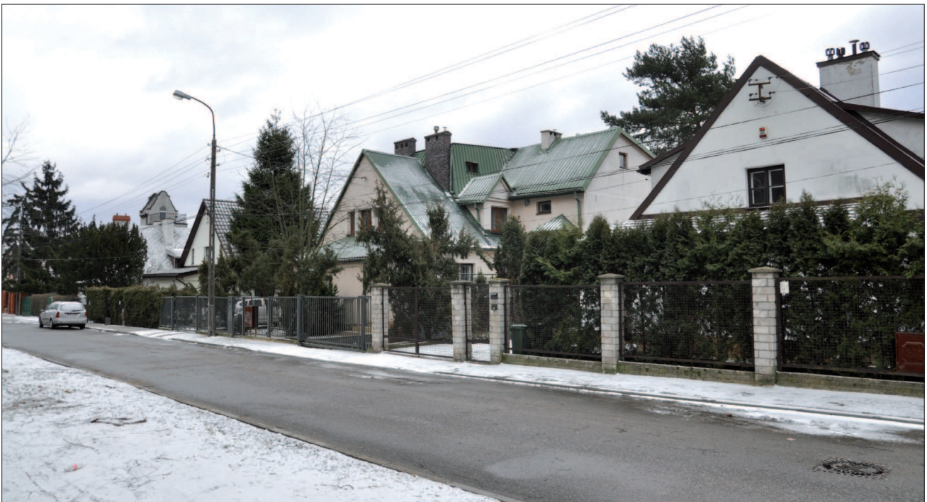
35. Warszawa, rząd przebudowanych domów wolnostojących „typ 13” z zachowanymi zarysami frontowych ścian szczytowych. Południowa strona ul. Dobrogniewa. Fot. Autorka, 2010 r. 35. Warsaw, a row of modernised detached houses “type 13” with remaining shape of the front walls. Southern frontage of Dobrogniewa Street. Photo by the Author, 2010