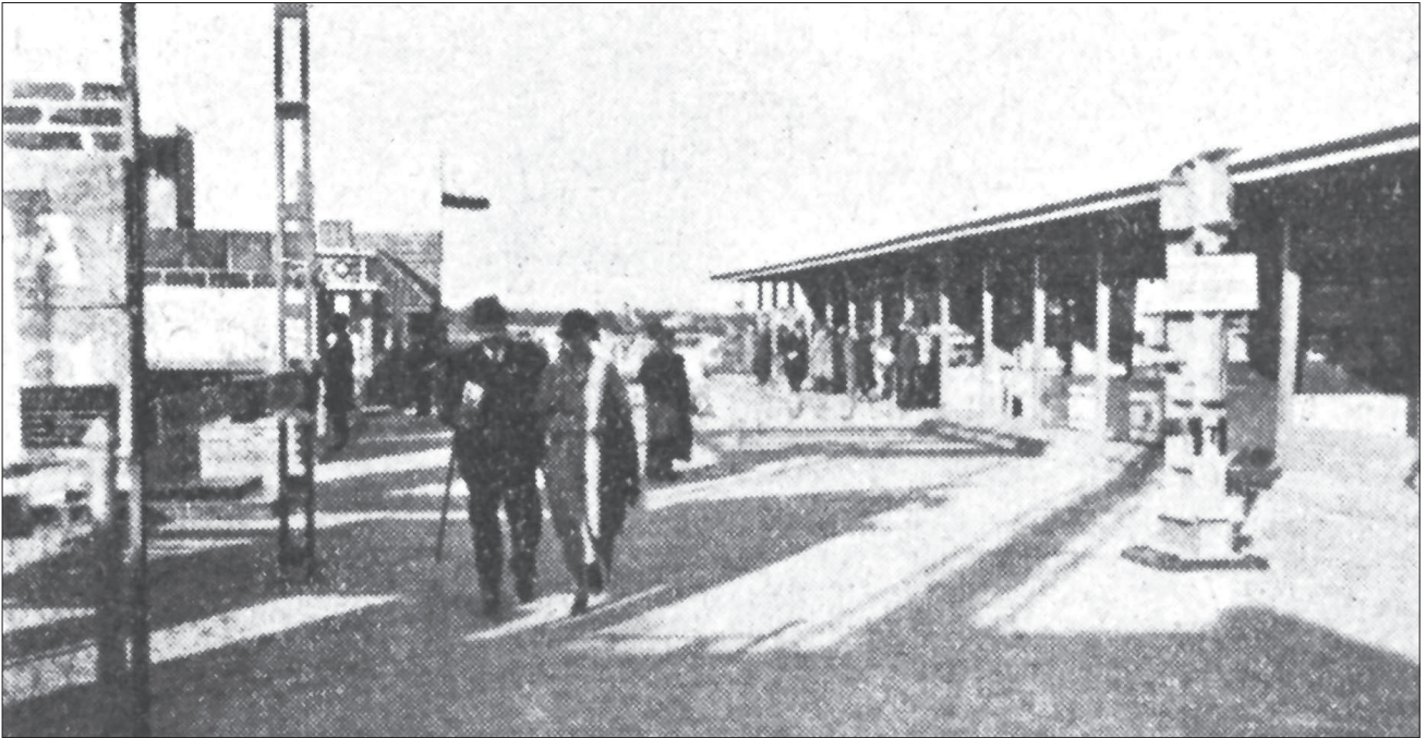
28. Warszawa, wschodnie skrzydło pawilonu widoczne od strony dziedzińca, 1935 r. 28. Warsaw, eastern wing of the pavilion as seen from the courtyard, 1935 .