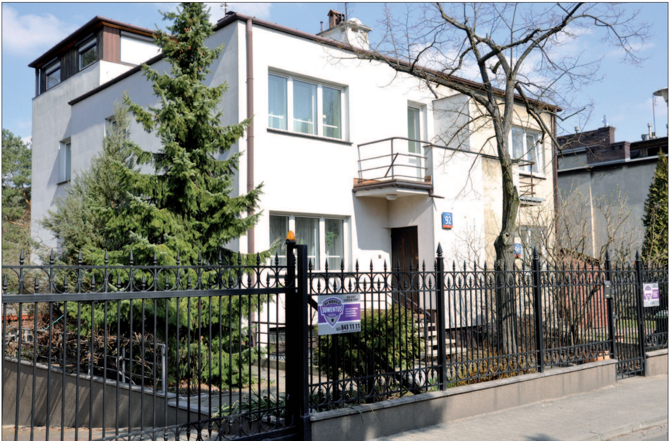
24. Warszawa, dom bliźniaczy „typ 151”, 1935 r. Proj. Mieczysław Łockikowski. Północna strona ul. Bolecha. Fot. Autorka, 2011 r. 24. Warsaw, semidetached house „type 151”, 1935, designed by Mieczysław Łockikowski. Northern frontage of Bolecha Street. Photo by the Author, 2011