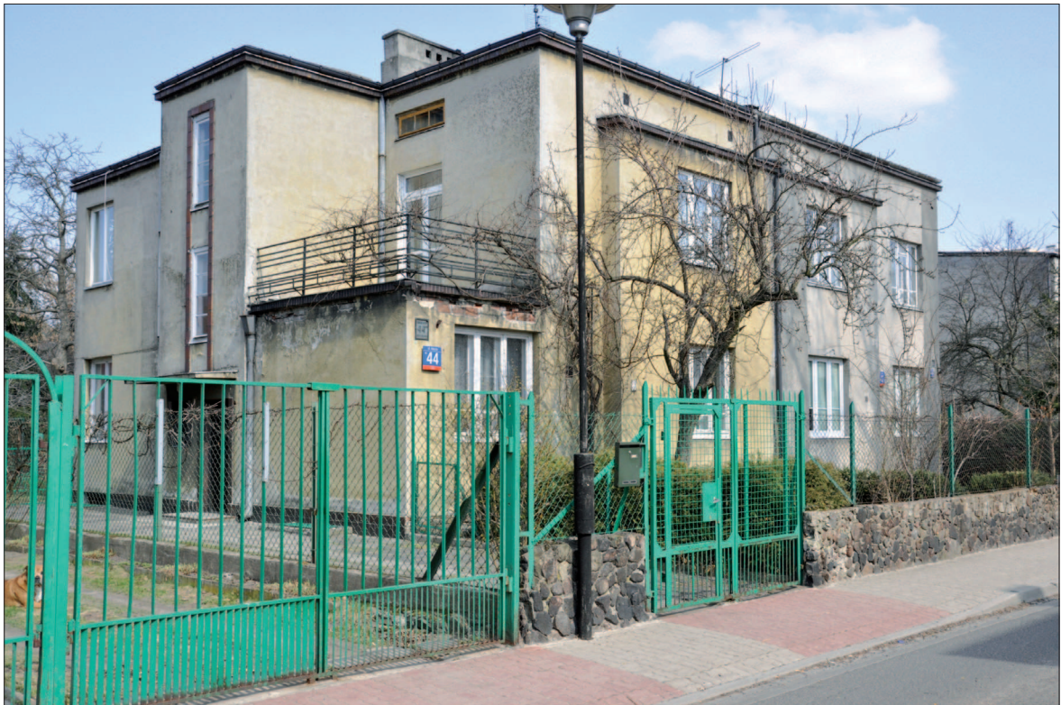
31. Warszawa, dom bliźniaczy, ok. 1936-39. Proj. nieznan. Północna strona ul. Bolecha. 31. Warsaw, semidetached house, ca. 1936 – 39, unknown designer. Norther side of Bolecha Street.