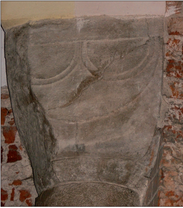
7. Trzemeszno, kościół opactwa kanoników regularnych, głowica kolumny. 7. Trzemeszno, church of the regular canon abbey, capitel of the column.

w Tumie pod Łęczycą i opactwie tynieckim, określono na podstawie odnalezionych dystyngtoriów, wybitnych dzieł sztuki złotniczej, wysoką rangę pochowanych osób duchownych, biskupa i opata, nie wymieniając ich z imienia i nazwiska, ku czemu brakło podstaw. Bez wątplenia dane kalibrowanych dat w wypadku katedry poznańskiej wnoszą konstruktywne korekty zarówno odnośnie chronologii, jak i kształtu pierwotnej budowli, wyznaczając jednocześnie granice hipotez rekonstrukcyjnych. Podkreślić należy, że zawdzięczamy to możliwości pobrania znacznej ilości próbek w rezerwacie archeologicznym katedry poznańskiej. Takiej dostępności nie dają obiekty zachowane w postaci izolowanych fragmentów w obrębie budowli użytkowanych, a także, co może się wydać paradoksalne, częstokroć badanych i konserwowanych. Tak ma się rzecz z relikami palatium na Ostrowie Lednickim, które były przedmiotem amatorskich eksploracji w XIX w., a także wielokrotnych prac wykopaliskowych w XX w., których poziom nie odpowiadał dzisiejszym wymogom i możliwościom badawczym. Liczne zabiegi konserwujące spowodowały, że możliwe było pobranie zaledwie paru próbek. Interesujący jest rezul-