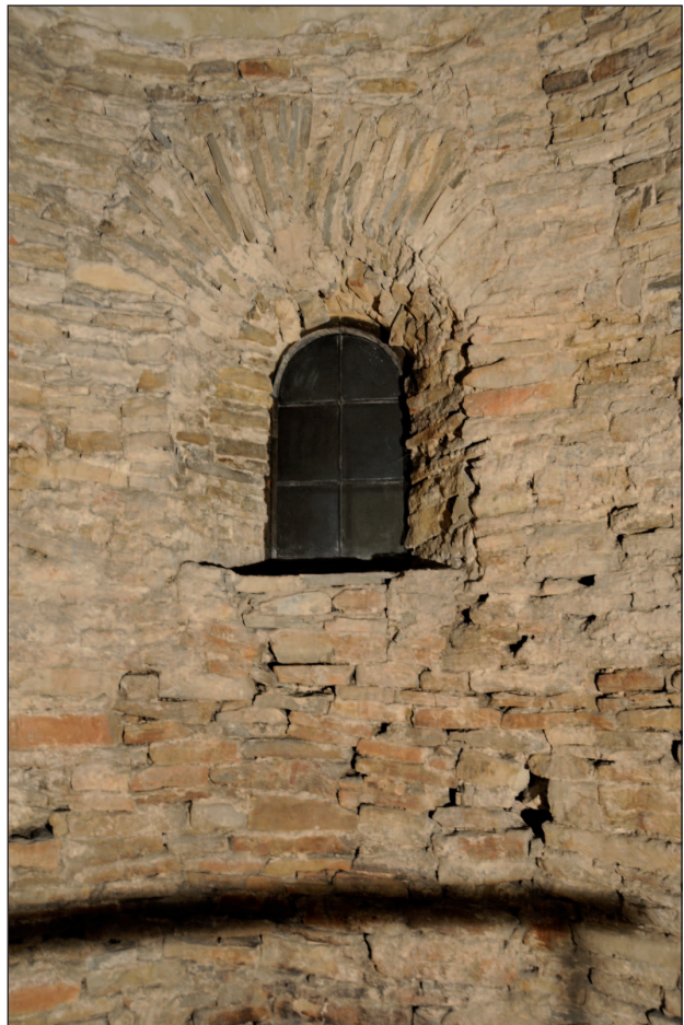
2. Rotunda św. Feliksa i Adaukta na Wawelu, otwór okienny 2. St. Felix and Adauctus rotunda at Wawel, window opening.