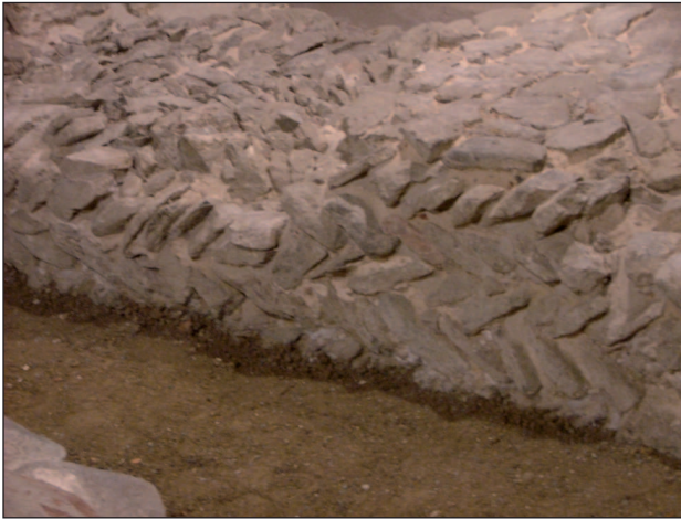
5. Katedra w Poznaniu, mur opus spicatum w masywie zachodnim. 5. Cathedral in Poznań, opus spicatum wall in Western edifice.