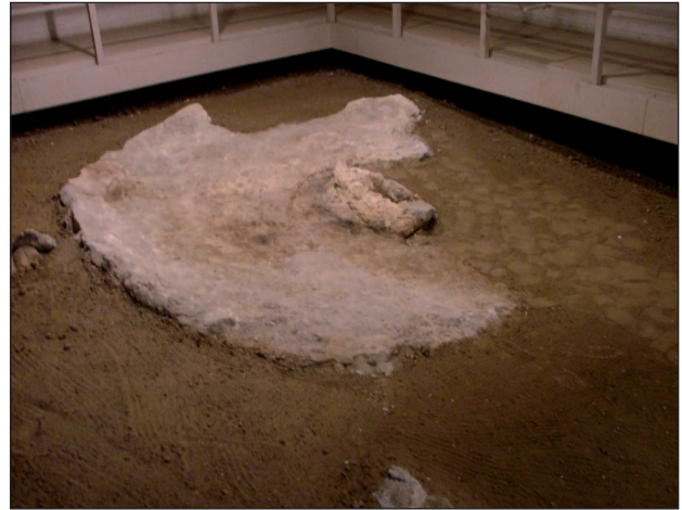
6. Katedra w Poznaniu, tzw. misa chrzcielna 6. Cathedral in Poznań, baptismal bowl.

„grząski”. Te same obawy nasuwa hipoteza odnośnie „transeptowego” rozwiązania elewacji zachodniej z powołaniem na analogię kościoła klasztorowego w Memleben. Niestety, brakuje minimum koniecznego dla prawidłowych wniosków porównawczych.