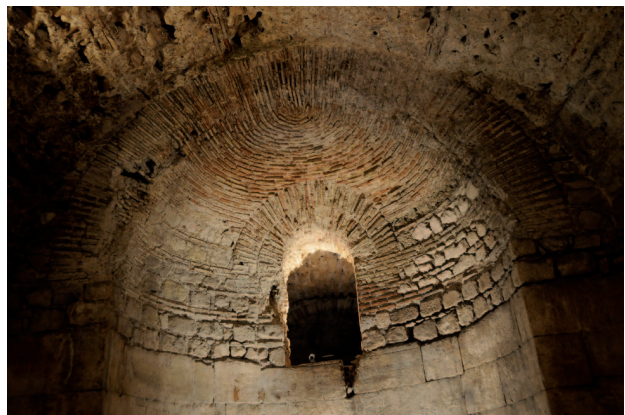
3. Pałac Dioklecjana w Splicie, otwór okienny 3. Diocletian's Palace in Split, window opening.