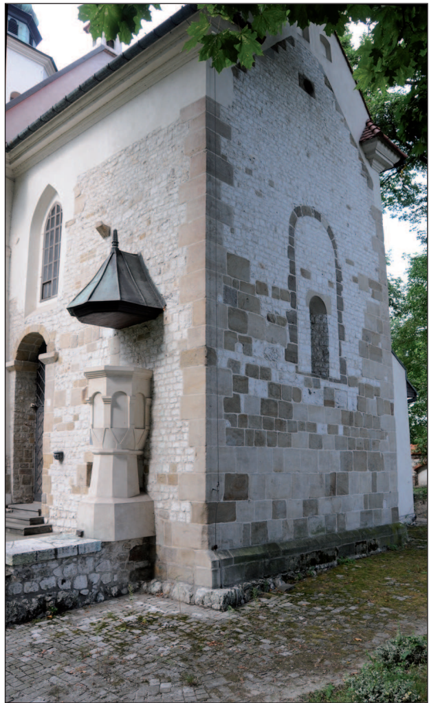
8. Kraków, kościół św. Salwatora, narożnik pld.-wsch. prezbiterium.