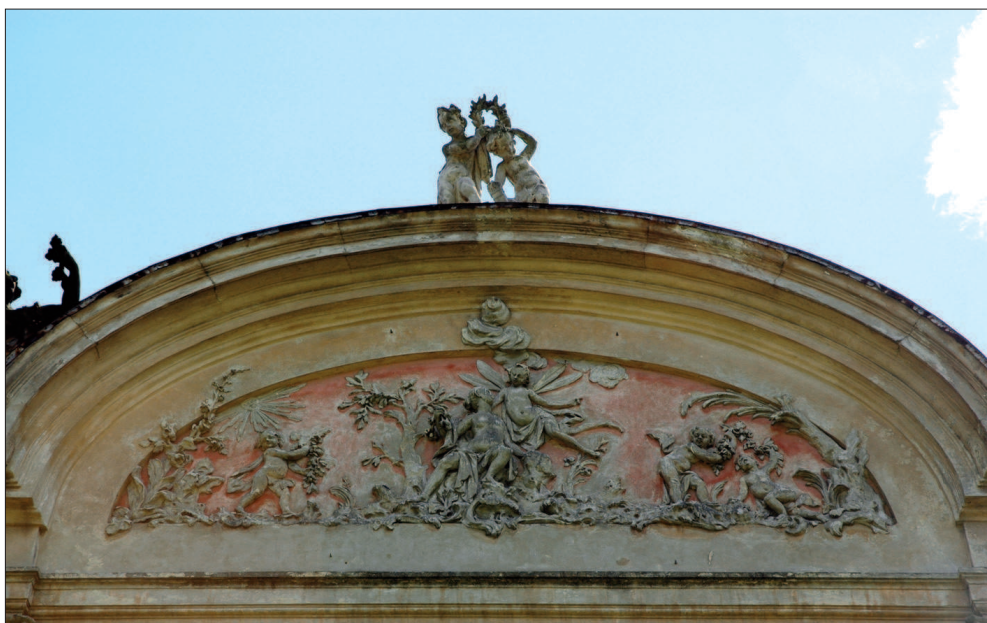
10. Radzyń Podlaski, Pałac Potockich, rzeźba Zefir i Flora na fasadzie ogrodowej pałacu, fot. M. Królikowska-Dziubecka, 2008 10. Radzyń Podlaski, Potocki Palace, Sculpture of Zephyr and Flora on the garden façade, photo: M. Królikowska-Dziubecka, 2008