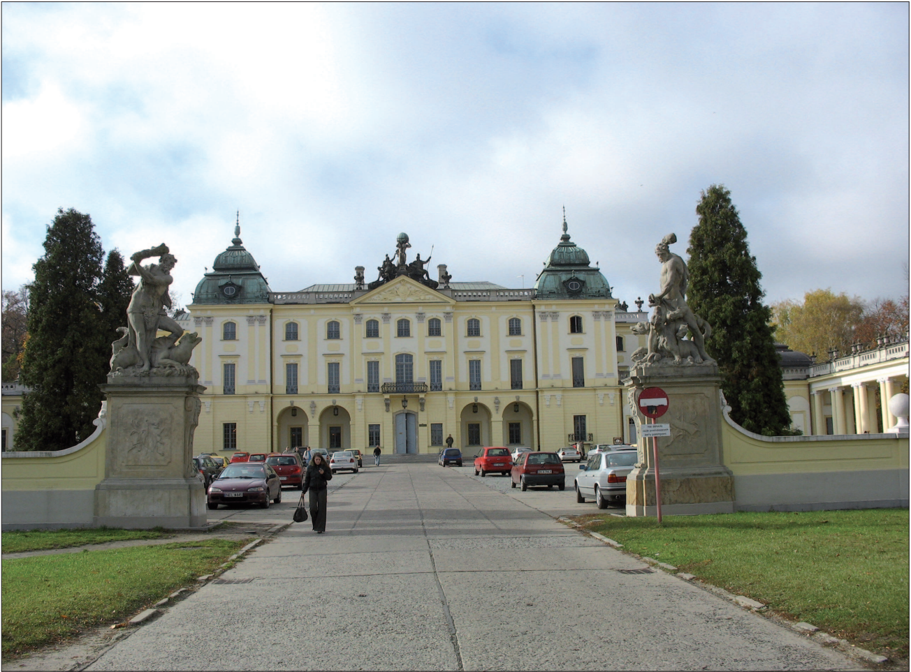
1. Białystok, Pałac Branickiego, Brama Herkulesów, 1. Białystok, Branicki Palace, Hercules Gate