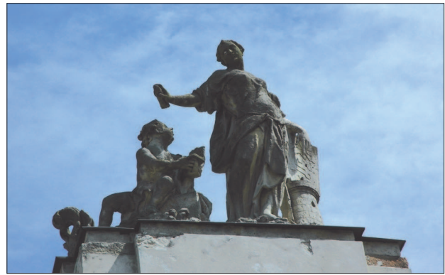
7. Radzyń Podlaski, Pałac Potockich, rzeźba Architektury Cywilnej, fot. M. Królikowska-Dziubecka, 2008 7. Radzyń Podlaski, Potocki Palace Sculpture of Civil Architecture, photo: M. Królikowska-Dziubecka, 2008

Koń mógł nawiązywać niewątpliwie do ikonografii Apollina – co stanowiłoby oczywiste pendant do symboliki Diany. Zazwyczaj jednak w scenach z bogiem słońca występują cztery konie, a zatem mamy tu do czynienia ze sceną o innym znaczeniu. Pausaniasz, opisując w Wędrownkach po Hel-