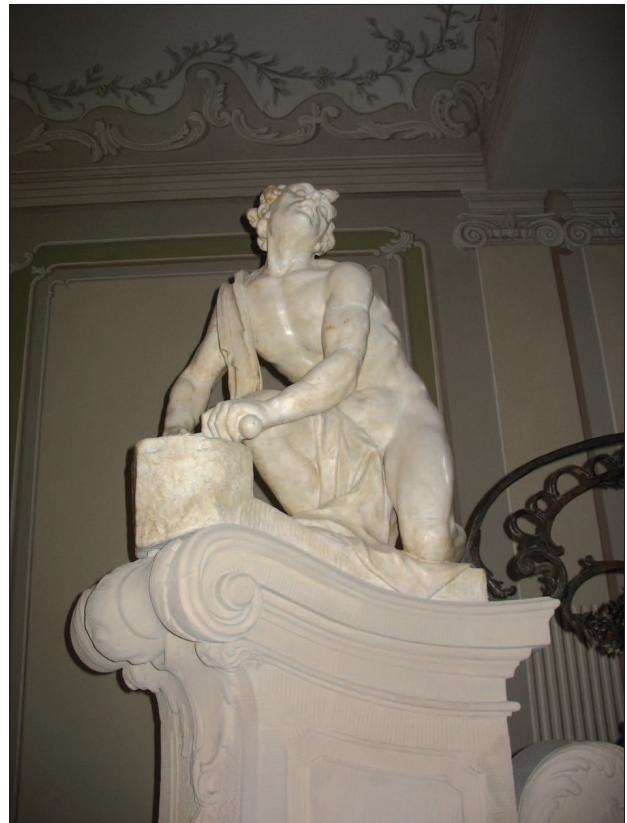
2. Białystok, pałac Branickiego, figura Rotatora w westybule, fot. Autor, 2007 2. Białystok, Branicki palace, figure of the Rotateur in the hall, photo: Author, 2007

W westybule pałacu białostockiego, u dołu reprezentacyjnych schodów prowadzących na piano nobile znajduje się marmurowa rzeźba półnagię mężczyzny ostrzającego nóż (il. 2). Została wykuta przez Jana Chryzostoma Redlera we wrześniu 1755 roku 16 i jest wzorowana na znanej figurze zwanej Arotino znajdującej się w zbiorach florenckiej galerii Uffizi. W 1567 roku została zakupiona przez Medyceuszy i od 1677 roku, z przerwą w czasach napoleońskich znajduje się we Florencji 17 . Ten marmurowy posąg był w czasach nowożytnych często kopiowany i naśladowany i z reguły znajdował się w ogrodach (np w Wersalu, przy angielskim pałacu w Blenheim). Arotino rozpowszechniany był najczęściej za pośrednictwem grafiki, która była zapewne wzorem dla wersji białostockiej, gdyż rzeźba została wykonana w lustrzanym odbiciu w stosunku do oryginału 18 . Przypuszczano, iż „ostrzący nóż” stanowi ilustrację epizodu z historii antycznego Rzymu, ukazującą niewolnika, który podsłuchuje knujących spisek przeciwko Juliuszowi Cezarowi, Neronowi bądź Tarkwiniuszom – w zależności od odniesień do lektury Tacyta, Plutarcha czy Liwiusza 19 . Trudno jednak przypuszczać, by Rotator białostocki wskazywał na