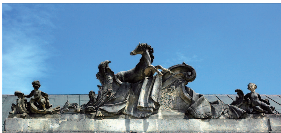
9. Radzyń Podlaski, Pałac Potockich, rzeźba na fasadzie prawego skrzydła pałacu, fot. M. Królikowska-Dziubecka 9. Radzyń Podlaski, Potocki Palace, Sculpture on the right wing of the palace, photo: M. Królikowska-Dziubecka, 2008