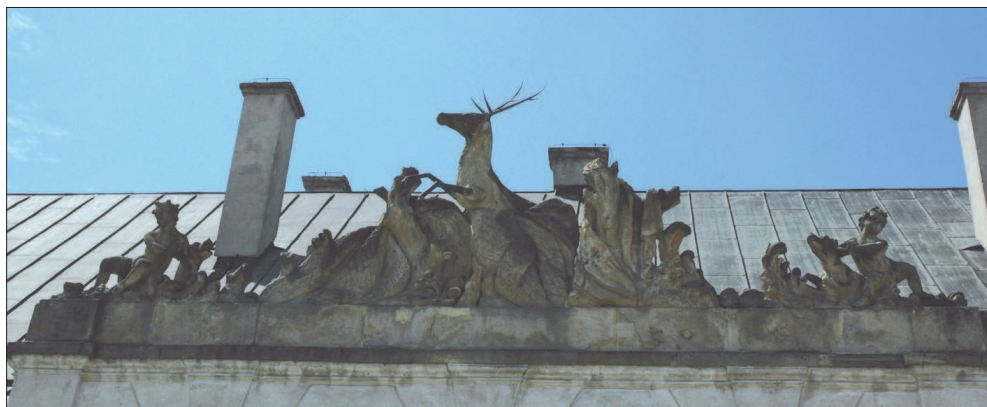
8. Radzyń Podlaski, Pałac Potockich, rzeźba na fasadzie lewego skrzydła pałacu, fot. M. Królikowska-Dziubecka, 2008 8. Radzyń Podlaski, Potocki Palace, Sculpture on the left wing of the palace, photo: M. Królikowska-Dziubecka, 2008