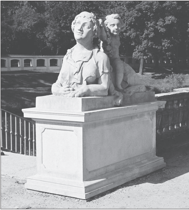
4. Białystok, Pałac Branickiego, rzeźba Sfinksa w ogrodzie, fot. M. Królikowska-Dziubecka, 2007