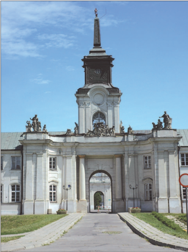
6. Radzyń Podlaski, pałac Potockich, brama główna, fot. M. Królikowska-Dziubecka, 2008