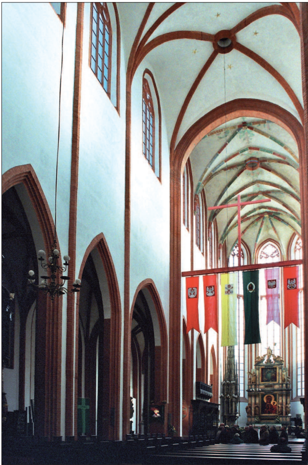
26. Wrocław – kościół św. Elżbiety, wnętrze 26. Wrocław – interior of the Church of St. Elizabeth