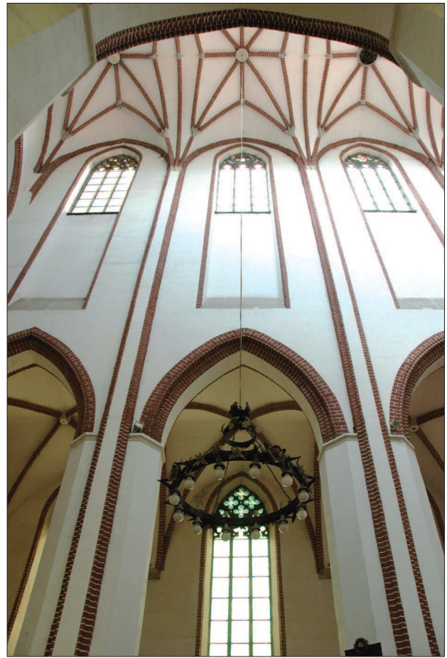
27. Brzeg – kościół św. Mikołaja, elewacja wewnętrzna 27. Brzeg – internal elevation of the Church of St. Nicholas

lach od 1:1,9 do 1:1,4 72 . W bazylikach przeważają przeszła prostokątne, natomiast w halach w połowie kościołów zastosowano przeszła kwadratowe w nawach głównych i odpowiadające im przeszła prostokątne w nawach bocznych. W większości przekryte zostały sklepieniami gwiaździstymi i pięciopodporowymi. Takie połączenie sklepień w bazylice wystąpiło tylko jeden raz w prezbiterium wrocławskiego kościoła św. Marii Magdaleny. Kościoły bazylikowe w nawach głównych otrzymały wyraźną artykulację pionową lizenami, między którymi w górnej partii ścian znajdują się okna (il. 26). Tylko w Brzegu niższe okienne zostały przedłużone w dół i zakończone nad arkadami (il. 27). Przy długich płaszczyznach gładkich ścian między arkadami a oknami lizeny nadają wnętrzą korzystną artykulację pionową. W nawach bocznych bazylik lizeny są bardziej widoczne, występują na filarach i często także na ścia-