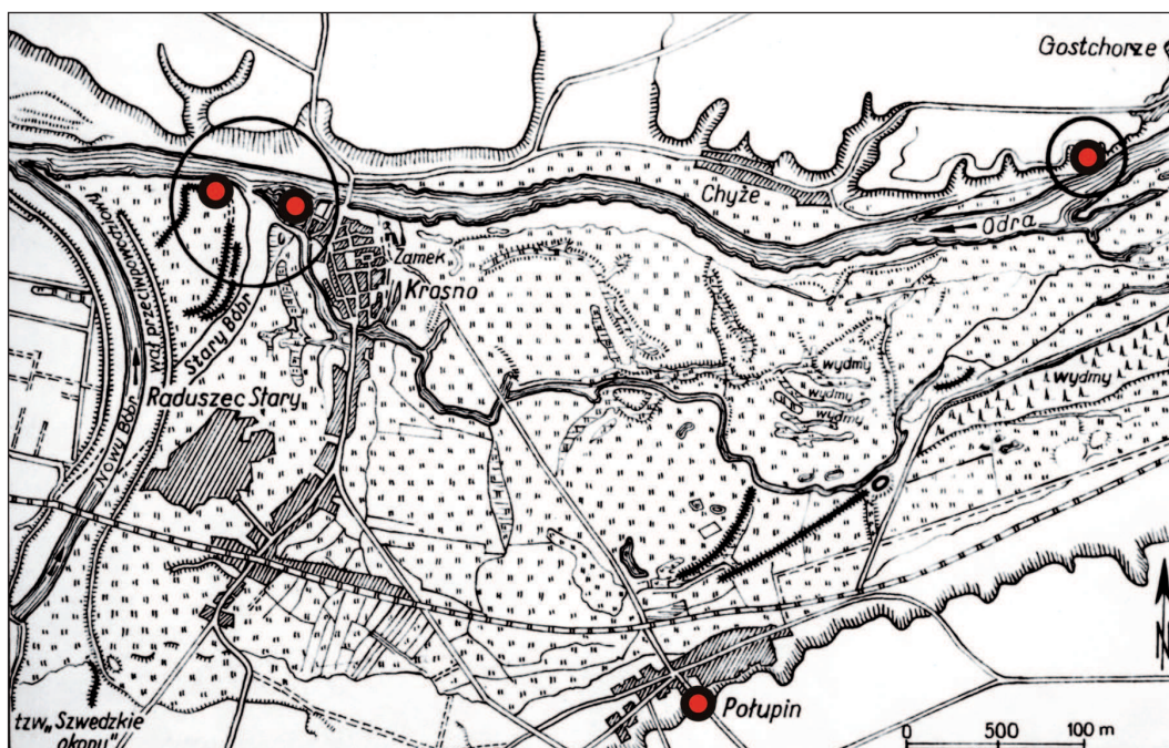
2. Mapa z zaznaczonymi miejscami wykopalisk 2. Map with marked excavation sites

wyniesienie krawędzi wybrzeży cieków wodnych stwarza bardzo dobre warunki dla obrony przed potencjalnym najeźdźcą przybywającym od strony zachodniej. Stąd wczesne daty tutejszego osadnictwa sięgającego VI wieku, jak wskazują relikty naczyń ceramicznych odnalezionych i opracowanych przez Dąbrowskiego. Z ok. 1400-letniej historii ziemi krośnieńskiej wybrał on okres najważniejszych trzynastu lat pomiędzy 1005 a 1018 rokiem. Zespół obronny sukcesywnie wówczas rozbudowywany odegrał kluczową rolę w odparciu przez Bolesława Chrobrego dwu najazdów cesarza Henryka II i toczącej w międzyczasie wojnie podjazdowej 4 . Położył jej kres dopiero korzystny dla Polski pokój w Budziszynie. Podstawę dla tak dokładnego datowania stwarza nieoceniona kronika Thietmara, który zapewne znajdował się w orszaku cesarskim w czasie jednej z wypraw 5 . Wskazuje na to szczegółowa znajomość topografii „Bramy Krośnieńskiej” poświadczona, jak zwrócił uwagę Dąbrowski, opisem meandrów krętego biegu dopływu Odry - rzeki Bóbr. Nie tylko koryta rzek i starorzeczy o wyniosłych nadbrzeżach,