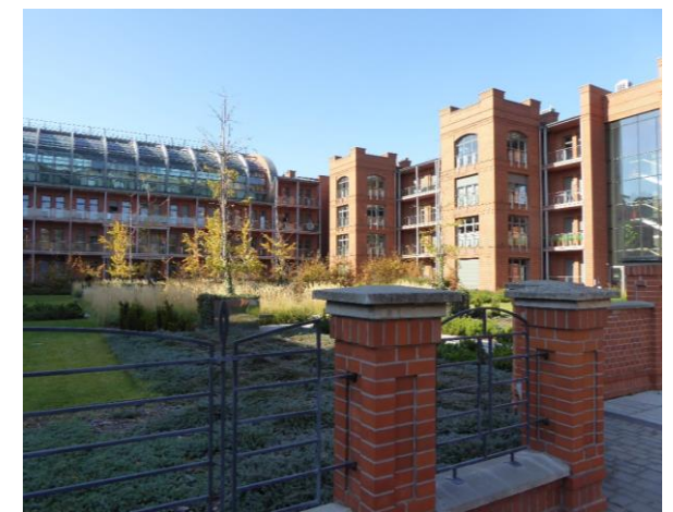
Il. 6. Architektura i przestrzeń społeczne współczesnych polskich osiedli: Gdańsk, Kraków, Wrocław, Poznań