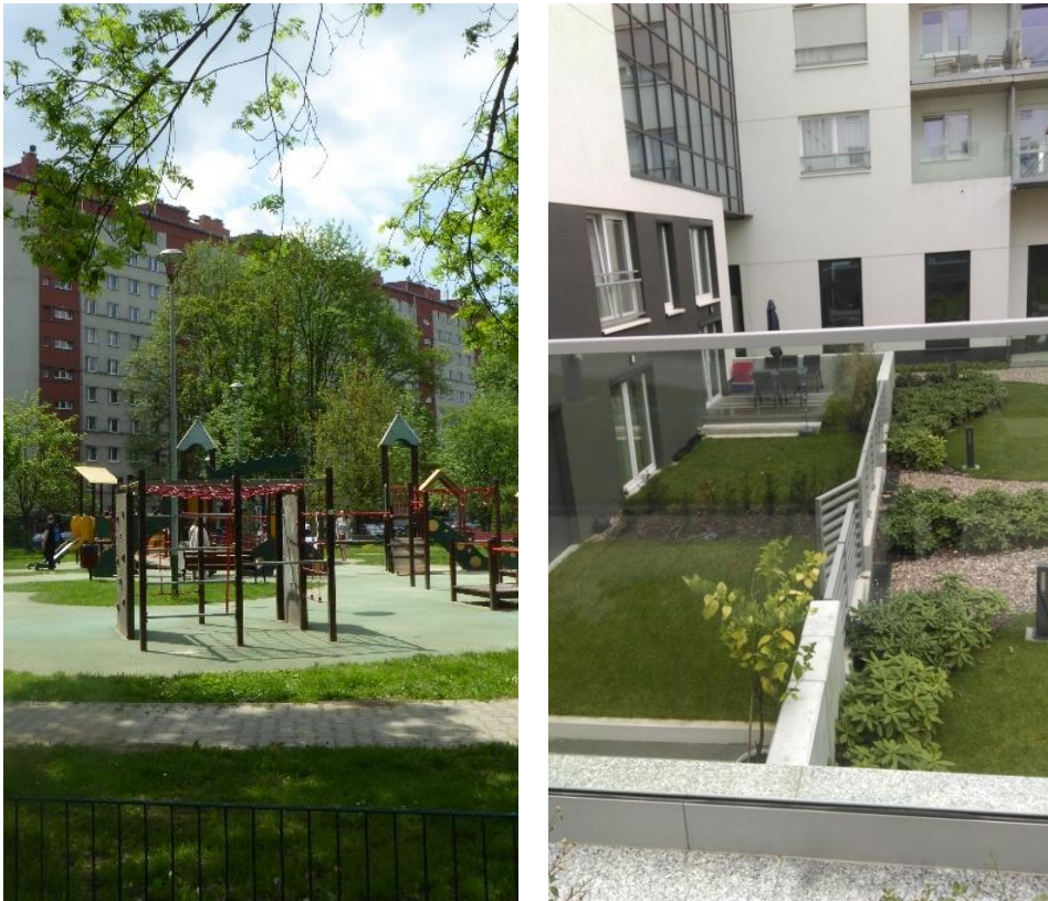
Il. 1. Osiedla krakowskie