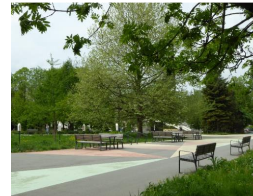
Il. 3. Zespół osiedli integralnych Mistrzejowice w Krakowie– stan z roku 2022