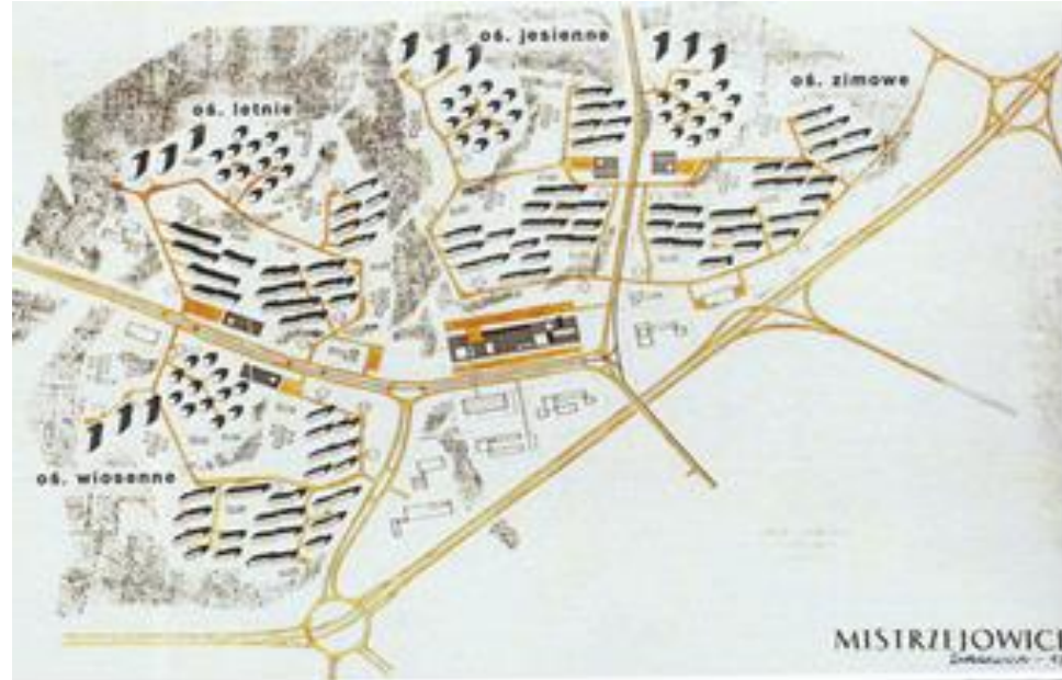
Il. 2. Zespół osiedli integralnych Mistrzejowice w Krakowie, lata 60. XX w., wersja konkursowa (Cęckiewicz W. 2016, Twórczość. Wyd. PK., s. 91)