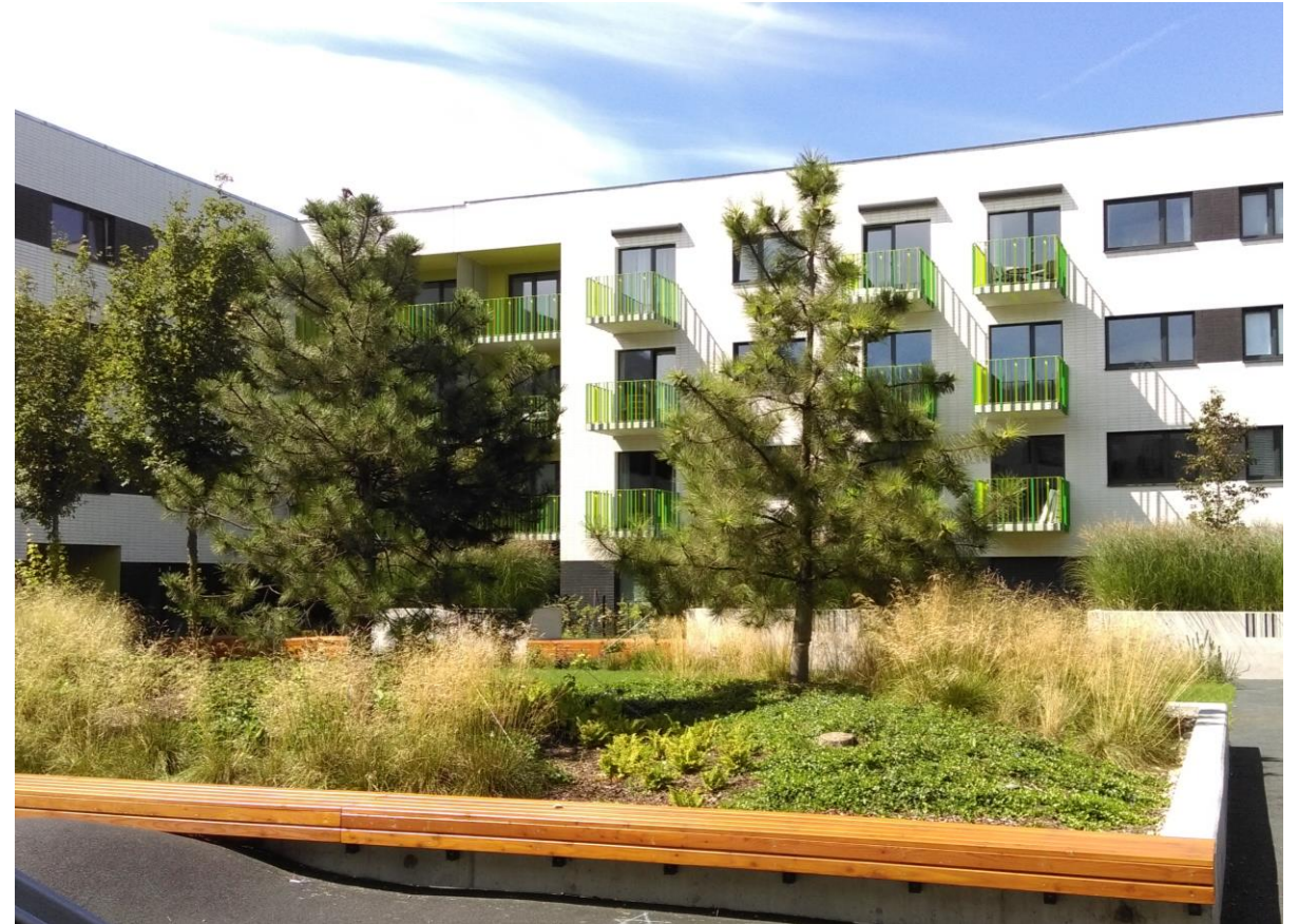
Il. 7. Osiedle Wizjonerów – Kraków, (fot. G. Schneider-Skalska)